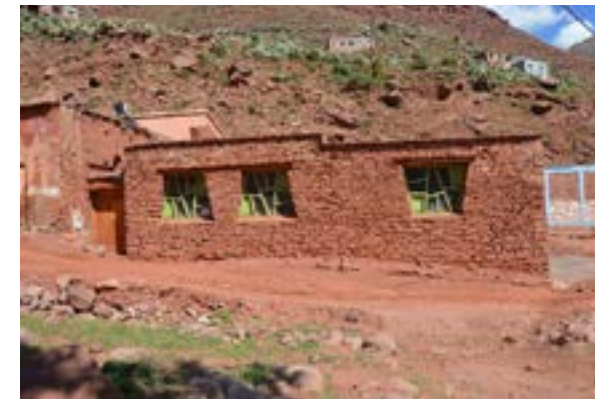
L'école maternelle d'Aguerd ( extérieur )

Frais de fonctionnement : 1 400 euros par an (contribution au salaire des maîtresses d'école)