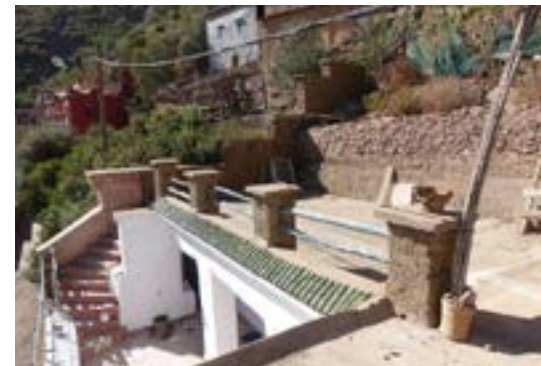
La maison achetée par AAA en 2017 (avant la construction du toit du premier étage)