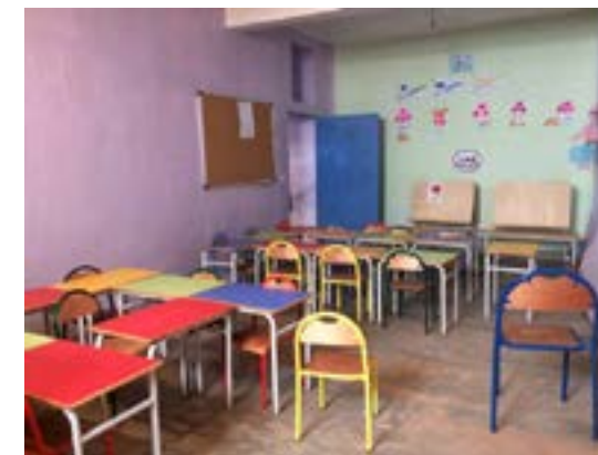
L'école maternelle de Tizi n'Oucheg ( salle de classe de moyenne et grande sections )