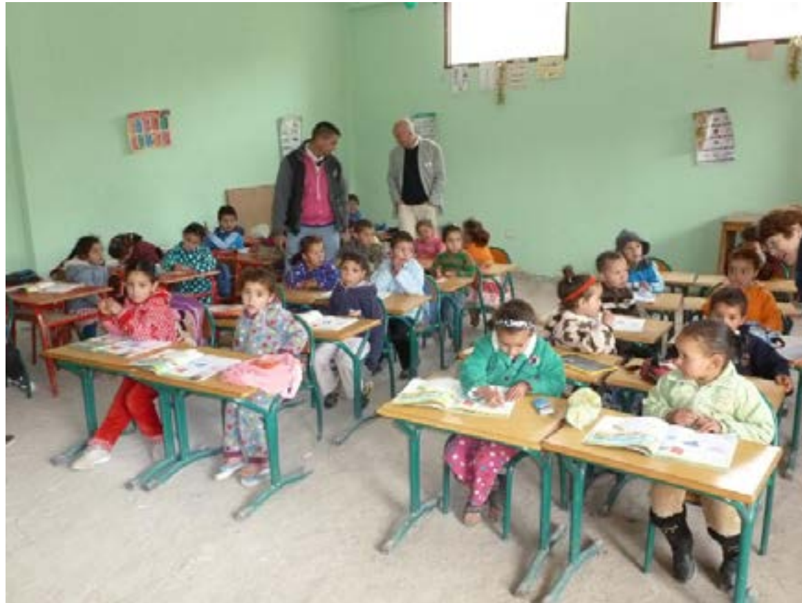
L'école maternelle de Douar Sbiti ( intérieur )

Contribution aux frais de construction : 4 000 euros