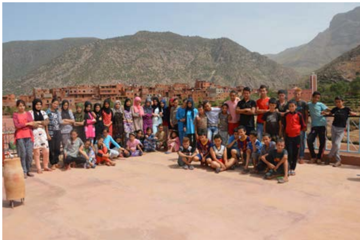
Les collégiens de Tizi n'Oucheg

Merci de nous communiquer vos nouvelles adresses quand celles-ci viennent à changer. Vous recevrez votre reçu fiscal 2018 un mois avant votre déclaration d'imposition pour éviter de faire des duplicatas.