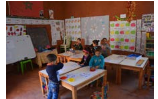
L'école maternelle d'Aguerd ( salle de classe des moyenne et grande section )