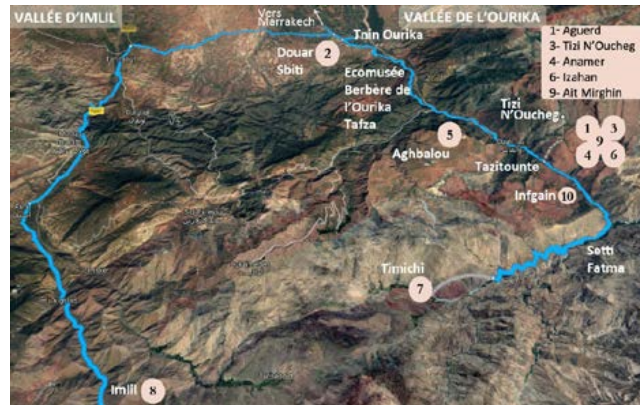
Localisation des villages

Nous remercions aussi tout particulièrement le Ministère de l'Éducation du Maroc à Marrakech.