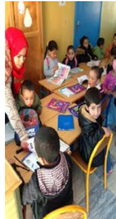
L'école maternelle d'Imlil (intérieur)

Frais de fonctionnement : 1 200 euros (contribution au salaire de la maîtresse d'école)