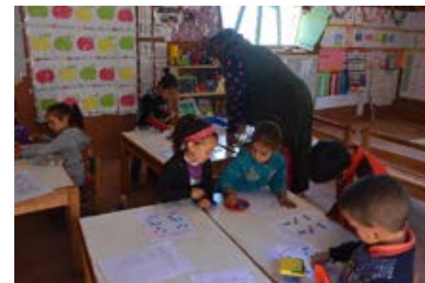
L'école maternelle d'Aguerd ( salle de classe des moyenne et grande sections, avec Meriam )