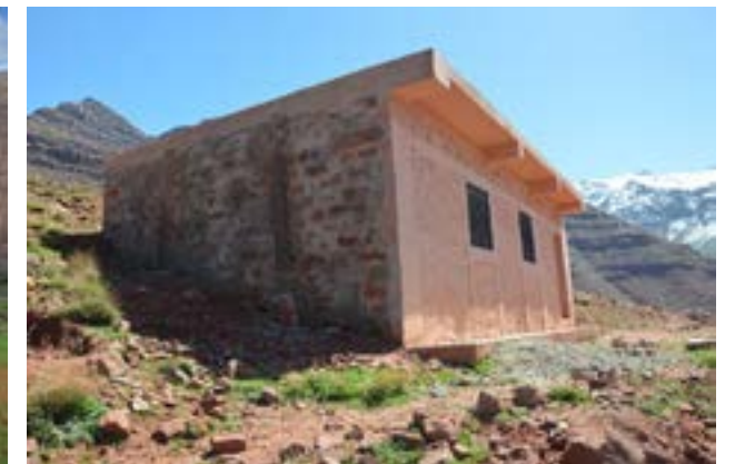
L'école maternelle d'Izahan ( extérieur )