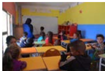
L'école maternelle d'Anamer ( moyenne et grande sections )