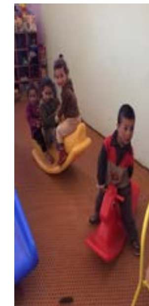
L'école maternelle de Tizi n'Oucheg ( salle de classe de la petite section )