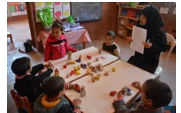
L'école maternelle d'Aguerd ( salle de classe des moyenne et grande section, avec Hasna )