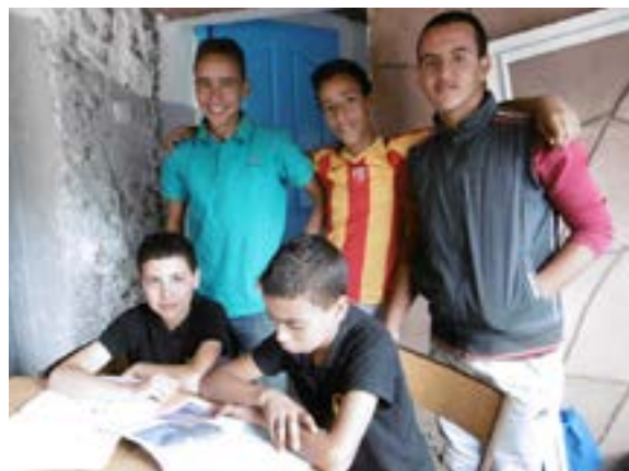
Cinq des garçons hébergés dans la maison achetée par AAA en 2017