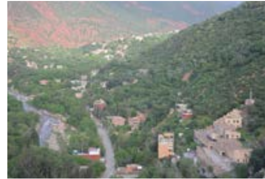
Vue de la vallée de l'Ourika (en bas à gauche, le collège)

Soutien de la fondation Archambault, de Coeur Maghrébin et d'un groupe de jeunes étudiants de Tessin (Suisse)