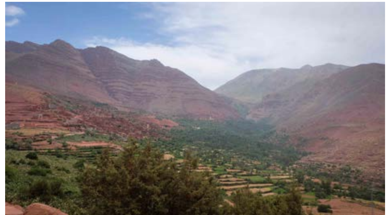
Haut Ourika, les villages (Aguerd, Anamer, Izahan)