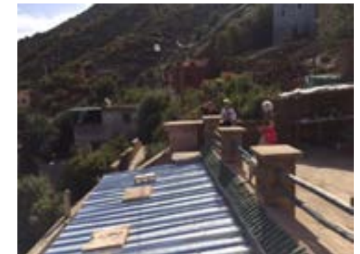
La maison achetée par AAA en 2017 (après la construction du toit du premier étage)