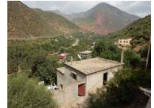
La maison louée par AAA en 2016