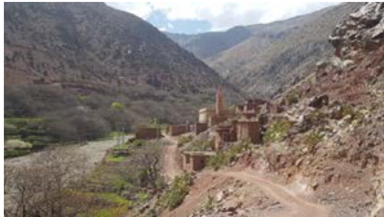
Le village de Timichi

Financement : don de la fondation Archambault : 5 000 euros