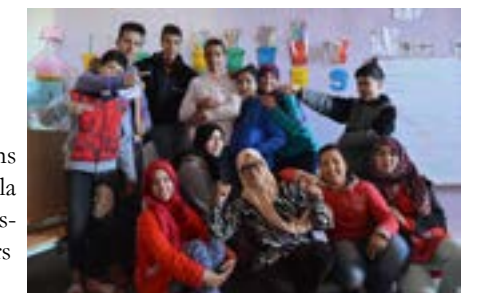
Les collégiens lors de la dernière session de cours (avril 2018)