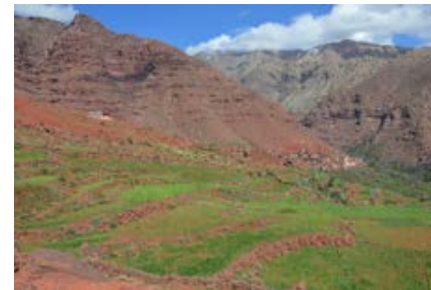
L'école maternelle d'Izahan ( en haut à gauche )

Équipement : Ministère de l'Éducation + AAA