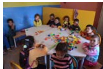
L'école maternelle d'Anamer ( petite section )