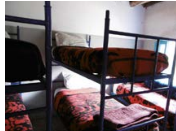
Une des chambres des garçons