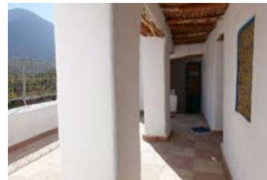
La maison achetée par AAA en 2017 (avant la construction du toit du premier étage)