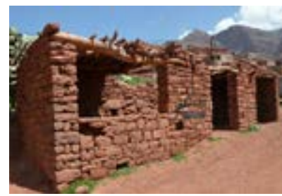
Le bâtiment jouxtant l'école maternelle permettrait un agrandissement.