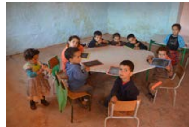
L'école maternelle d'Izahan ( intérieur )