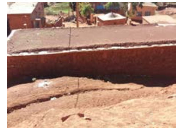
L'école maternelle d'Ait Mirghin avant travaux (avril 2018)