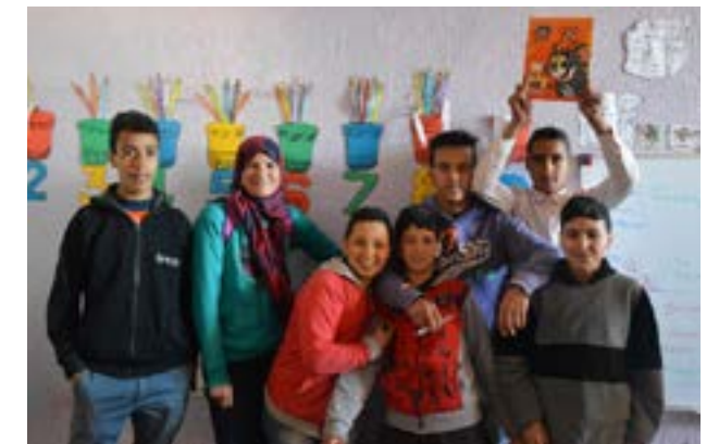
Les collégiens de Tizi n'Oucheg lors des cours de soutien de français (avril 2018)