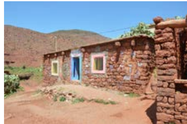
L'école maternelle d'Anamer ( fenêtres jaune et rose et porte bleue ) se situe au-dessus du terrain de football.