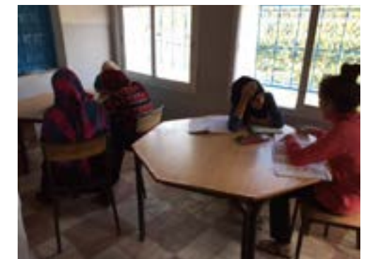
La maison achetée par AAA en 2017 (après la construction du toit du premier étage)