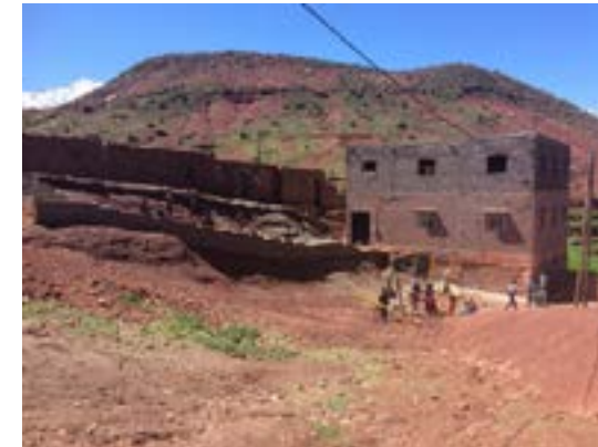
L'école maternelle de Tizi n'Oucheg ( rez-de-chaussée du bâtiment ) et son aire de jeux

Frais de fonctionnement : 2 400 euros par an (contribution aux salaires de deux maîtresses d'école)