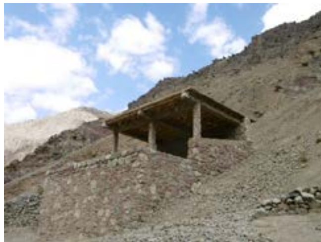
L'ancien lavoir pouvant être réhabilité en classe de maternelle