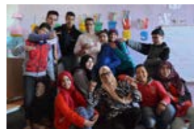
Les collégiens lors de la dernière session de cours (avril 2018)