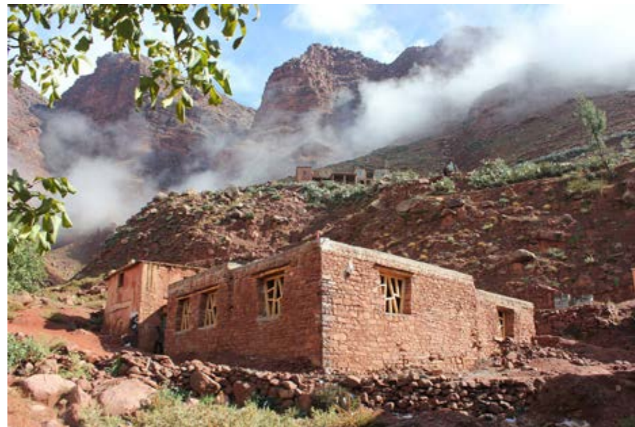
L'école maternelle d'Aguerd ( extérieur )

Pour le détail de ce programme, voir notre fascicule tiré à part.