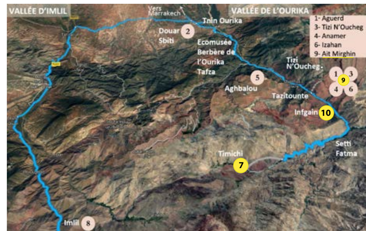
Localisation des sites concernés par notre programme 2018 En jaune, les ouvertures prévues en septembre 2018

Budget : Le fonctionnement est intégralement couvert par des dons de particuliers. Les dons de fondations -exceptionnels- permettent les investissements pour la construction des classes.