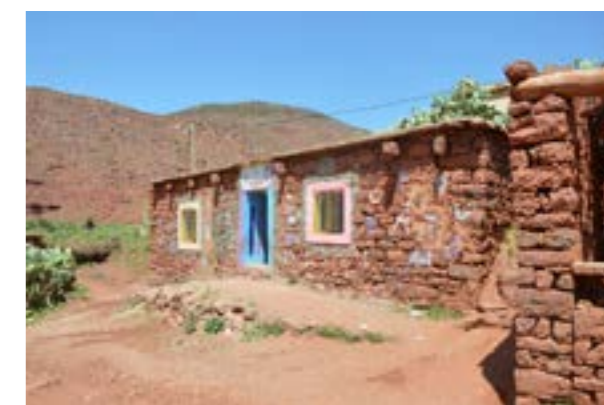
L'école maternelle d'Anamer ( fenêtres jaune et rose et porte bleue ) se situe au-dessus du terrain de football.