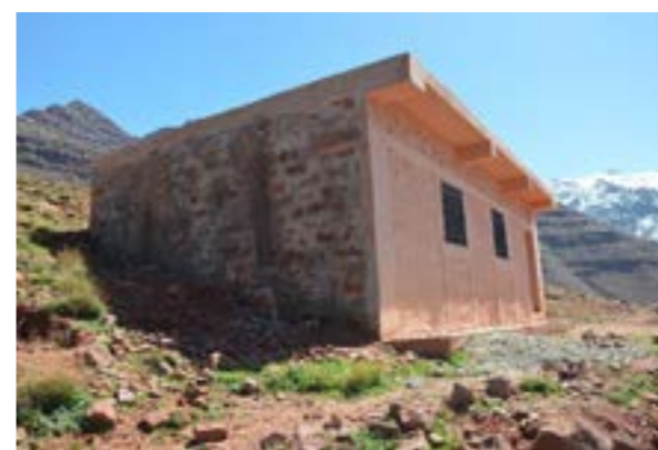
L'école maternelle d'Izahan ( extérieur )