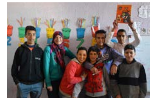
Les collégiens de Tizi Noucheg lors des cours de soutien de français (avril 2018)