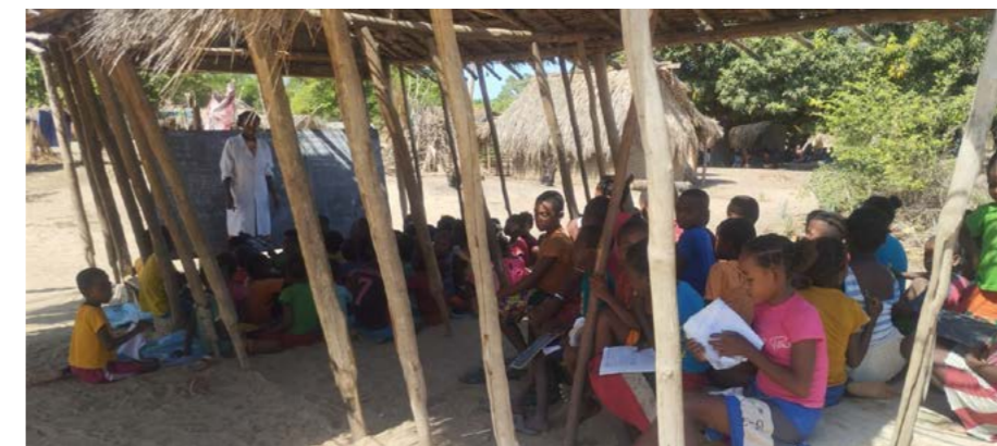
École proche d'Ankevo, Madagascar 2024

Budget prévisionnel 2025 : 70 000 euros dont contribution AAA + Pêcheurs: 15 000 euros