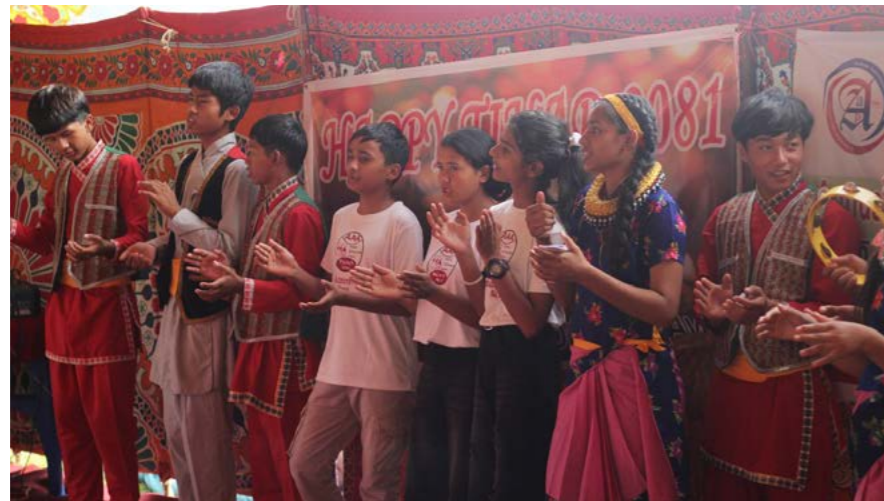
Fête de Tihar, Népal 2024

Au Maroc, les programmes vont bien. Nous nous appuyons sur des Associations locales, dont celle de Tizi N'Oucheg dans le Haut Atlas. Nour Eddine a ouvert depuis 2 ans un petit internat pour 14 jeunes filles dans l'Ourika, à côté du lycée, en plus de son activité professionnelle de guide de montagne.