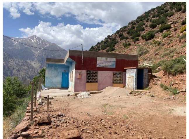
Village Wigrane, 2026