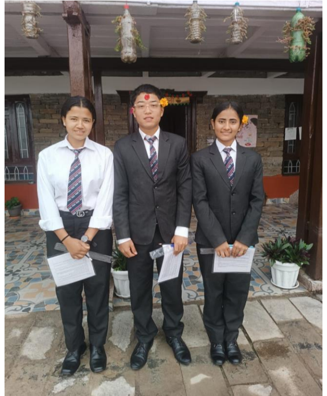
Mélamchi, Népal, 2026