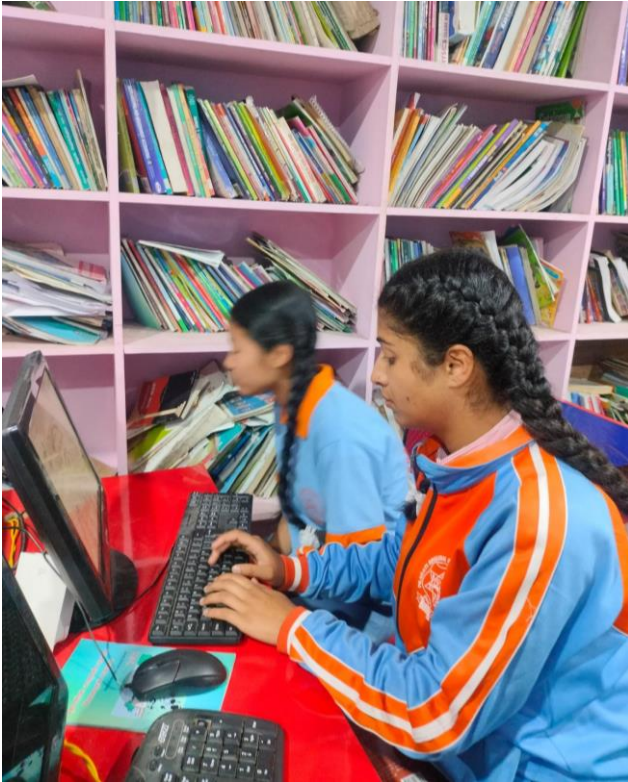
Notre avenir à tous, Népal, 2026