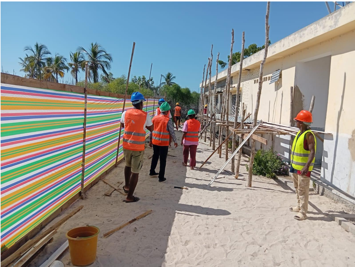
L'hôpital (sans medecin) de Belo sur mer en réparation, Madagascar, 2026