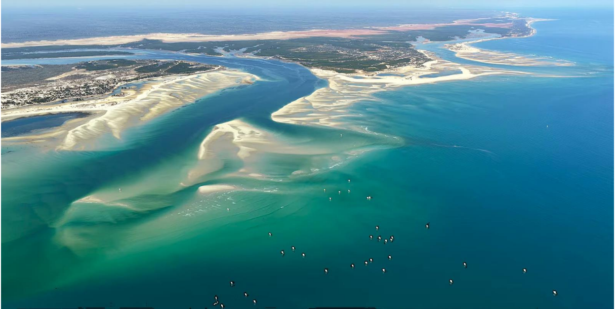
Vue panoramique de Belo sur mer, Madagascar, 2026